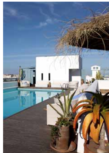
▲ Sur la terrasse au bord de la piscine

À quelques pas des plages de Mogador, aux portes de la Médina, le luxueux riad accueille 33 chambres s'ouvrant sur un large patio arboré. Surélevée, la maison compte désormais 3 étages où se lovent des chambres et des suites aux inspirations orientales, africaines, portugaises et anglaises. Empreintes de nostalgie, de détails raffinés en notes élégantes, la décoration joue avec la présence d'étoffes soyeuses, de tapis et d'objets