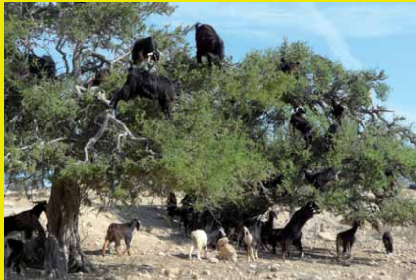
▲ Les chèvres grimpent dans les arganiers, elles mangent les fruits rejetant le noyau