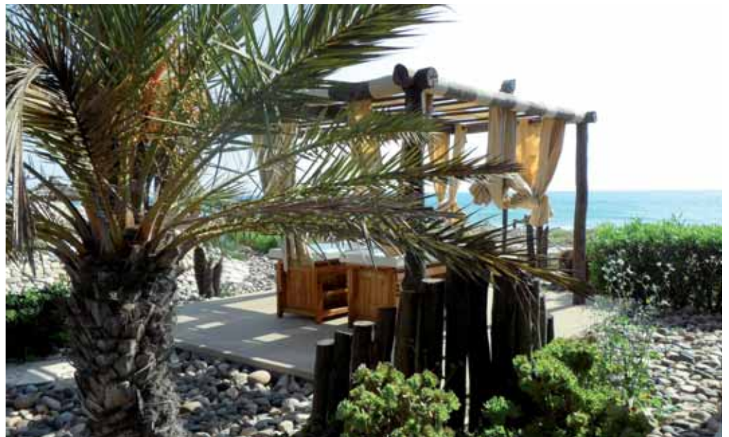
▲ Face à la mer, une situation unique pour s'adonner au bien-être et au yoga

Situé en bordure de l'Océan Atlantique, s'étirant le long de plages de sable fin, Agadir a été le premier pôle touristique du Maroc. De la forteresse de la Casbah, de ses ruelles et boutiques anciennes, il ne restait plus grand-chose après le tremblement de terre de 1960 qui a totalement redessiné l'image de la cité. Séduisant les visiteurs amoureux de son climat exceptionnellement doux toute l'année, aujourd'hui, de nombreux hôtels, restaurants et cafés d'inspiration européenne ponctuent de larges boulevards fleuris. Baignades et parcours de golf ont fait, entre autres, la réputation de la destination.