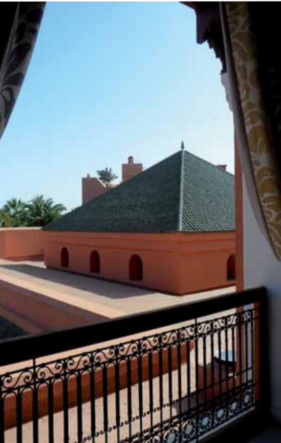
▲ Beauté des toits aux tuiles vernissées

À l'abri des regards, dans une tendre pénombre, en une superbe décoration et un aménagement parfait, La Villa des Orangers dévoile un Spa avec chambres de massages et cabines de soins de beauté. Une magnifique expérience sous la signature de Nuxe et, plus particulièrement, de son