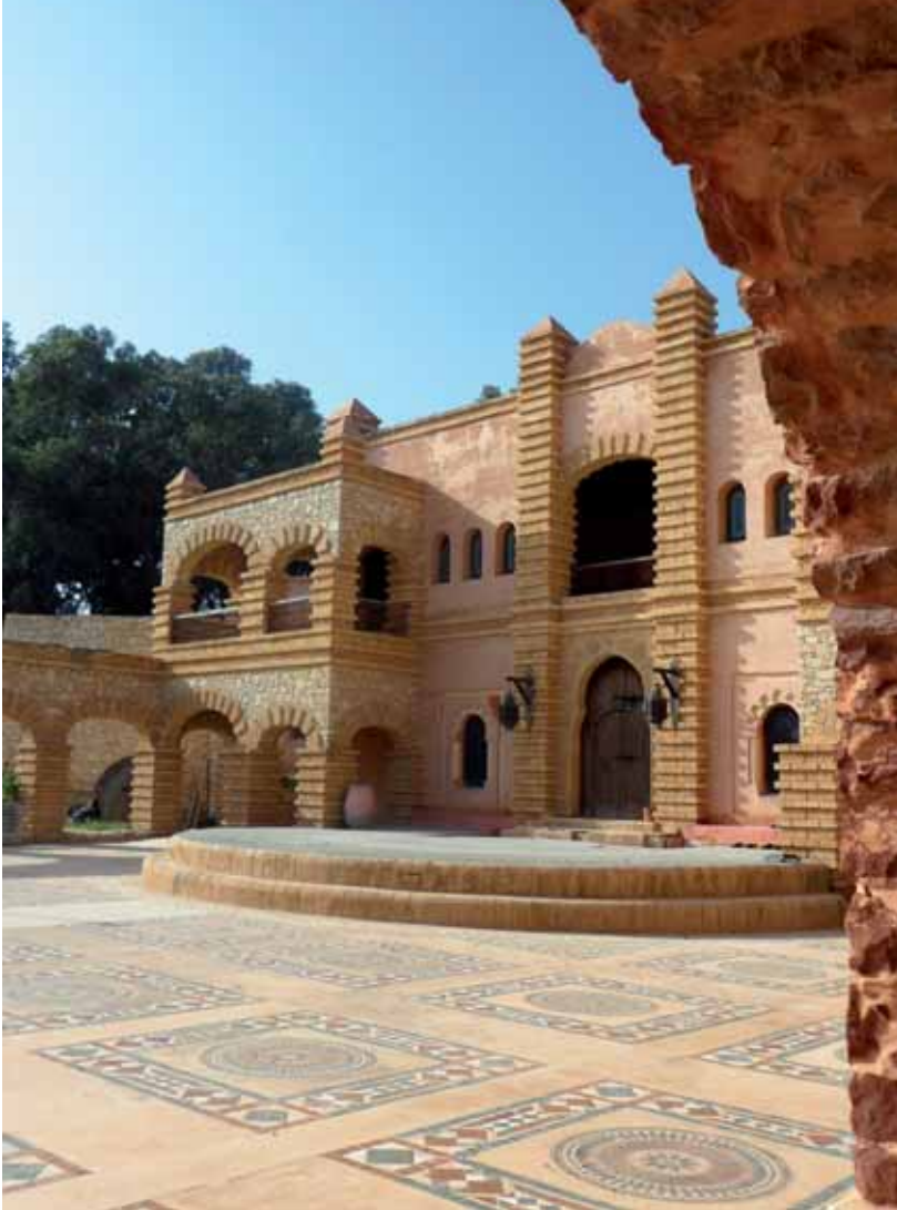
▲ Merveille de reconstitution, une cité nouvelle est née préservant artisanat et traditions