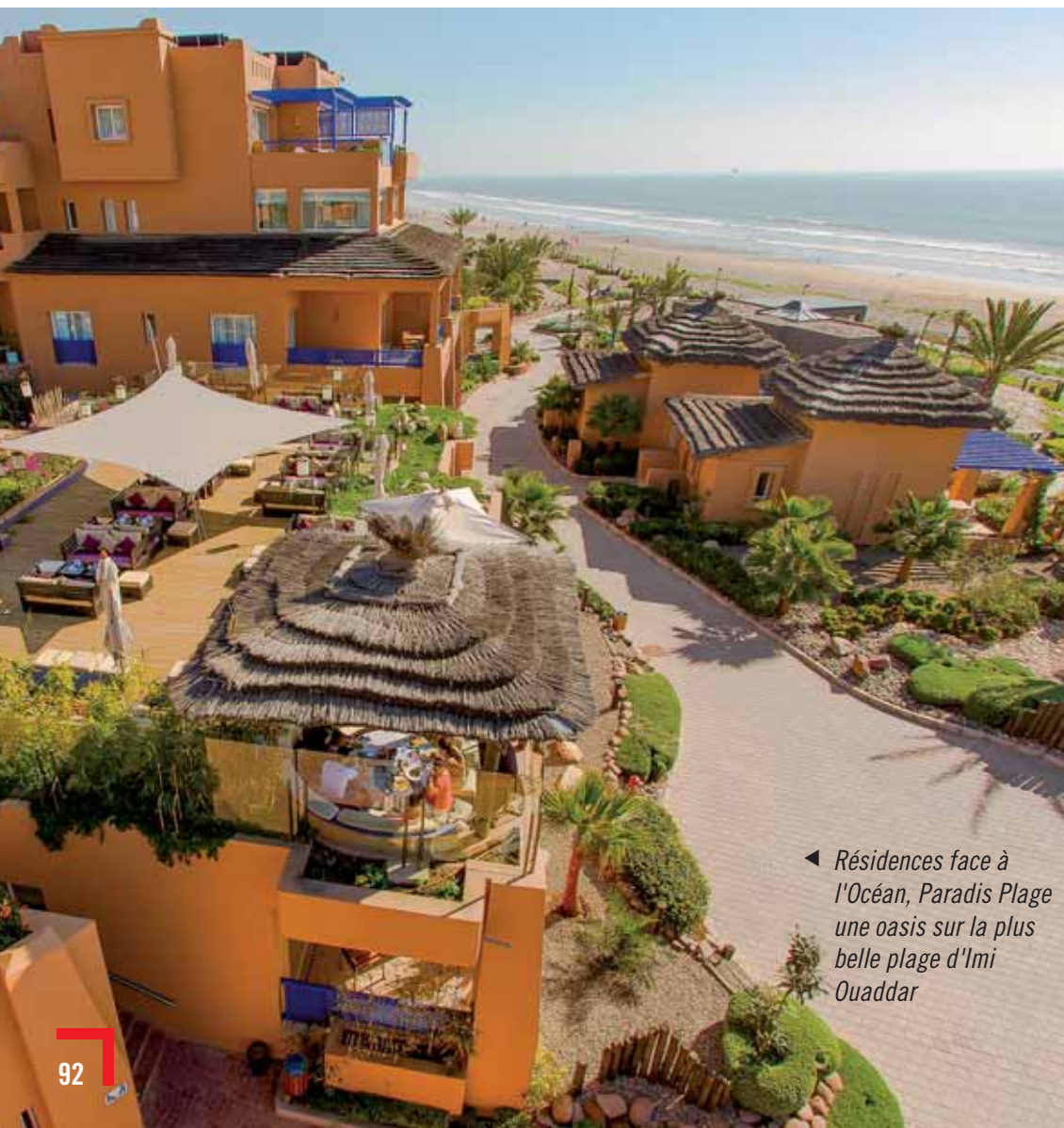
◀ Résidences face à l'Océan, Paradis Plage une oasis sur la plus belle plage d'Imi Ouaddar