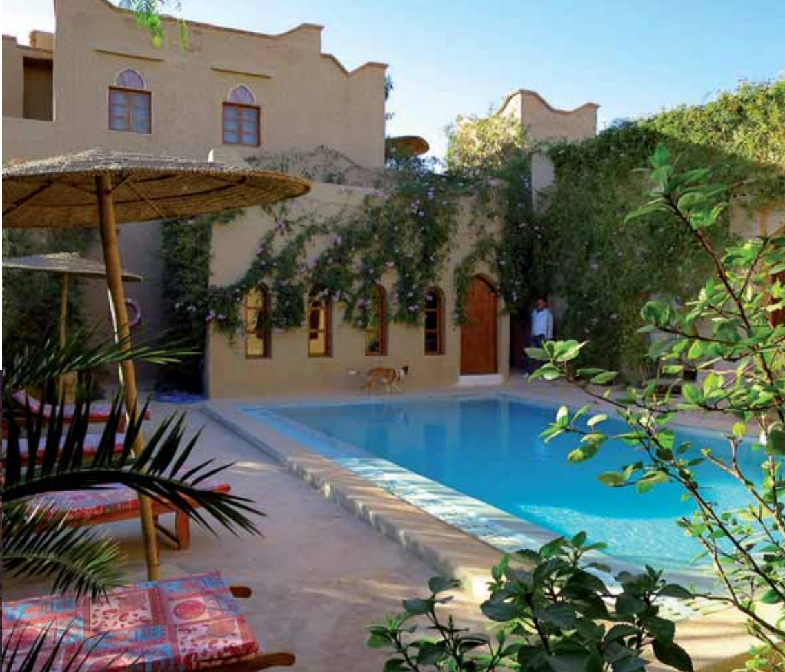
Un havre de paix et de bien-être loin des chemins convenus ▲

Au Spa, exclusivement manuels, les soins relèvent d'un rituel invitant à la détente, à la purification, au bien-être au moyen de produits naturels agrémentés d'huile d'argan bio et conçus sous haute surveillance. Si la piscine avenante et l'espace yoga inspirent la zénitude, en passionné de gastronomie, le maître des lieux a mis l'accent sur la table et développé des recettes gourmandes inspirées de la cuisine marocaine. Revisitées et allégées selon sa touche personnelle. Un régal de saveurs inattendues, de multiples splendeurs... Un havre de paix et de renouveau à découvrir. ▶