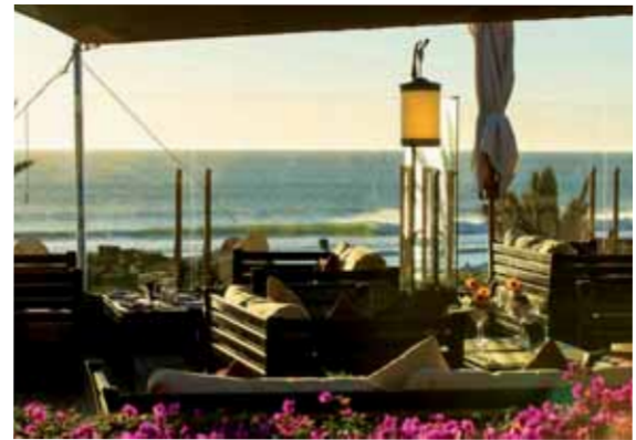
▲ Le lounge au bord de l'eau