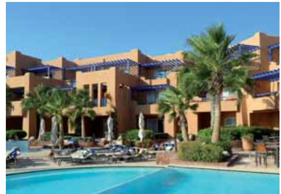
▲ La piscine au cœur du complexe